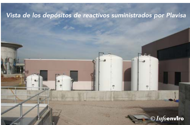
Vista de los depósitos de reactivos suministrados por Plavisa

The ballasted settling process is carried out on three ACTIFLO™ lines, of a maximum treatment capacity of 4800 m 3 /hour and a sedimentation velocity of 120 m/b. The process comprises coagulation, flocculation-maturing and lamellar