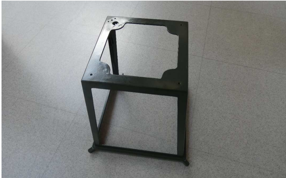
Figura 3. Se presenta uno de los componentes motivo de análisis. Referencia: Tulipa . Figure 3. Image of one of the analyzed components. Reference: Tulipa .