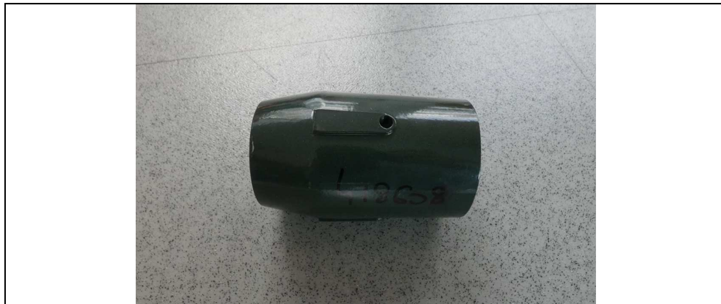
Figura 5. Se presenta uno de los componentes motivo de análisis. Referencia: Soporte . Figure 5. Image of one of the analyzed components. Reference: Soporte .