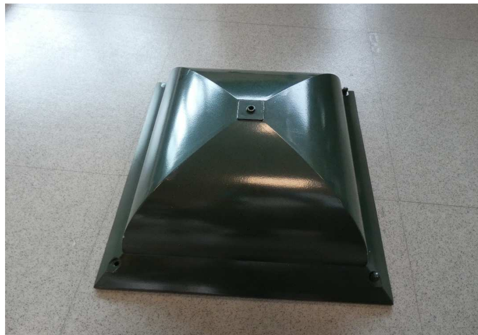
Figura 2. Se presenta uno de los componentes motivo de análisis. Referencia: Capucha .

Figure 1. Image of one of the analyzed components. Reference: Capucha superior .