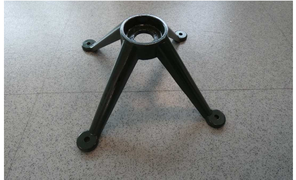
Figura 4. Se presenta uno de los componentes motivo de análisis. Referencia: Soporte interior . Figure 4. Image of one of the analyzed components. Reference: Soporte interior .